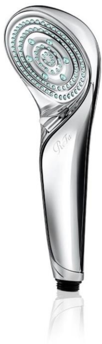
リファファインバブルS