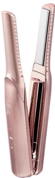
ReFa BEAUTECH FINGER IRON