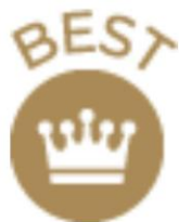
リファモーションカラット