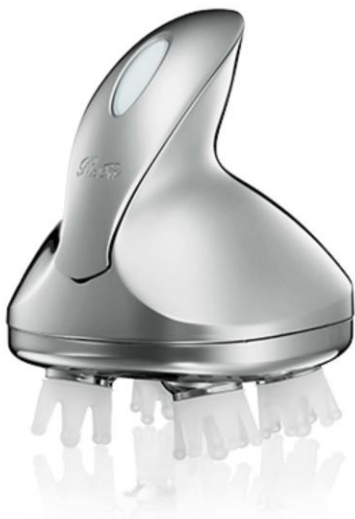
リファグレイス ヘッドスパ