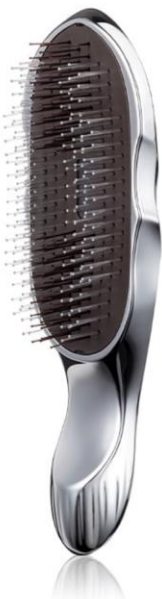
リファイオンケアブラシ